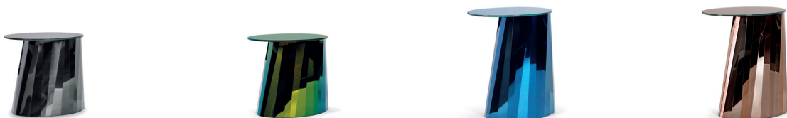
PLI SIDE TABLE LOW 2016