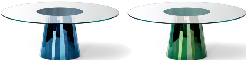
Saphir-blau, Tischplatte mittig lackiert Sapphire blue, tabletop lacquered in its centre