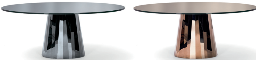
Onyx-schwarz, Tischplatte vollflächig lackiert Onyx black, tabletop fully lacquered

Mesa. Pie de chapa plegada de acero inoxidable con pulido de gran brillo en diversos colores. La coloración se ha aplicado utilizando un procedimiento especial. Tablero ovalado de cristal, con lacado brillante en el centro o en toda la superficie en el color del pie. O tablero ovalado de mármol Nero Marquina, pulido e impregnado. Tacos de fieltro, de altura regulable.