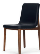
SEDAN CHAIR 2015