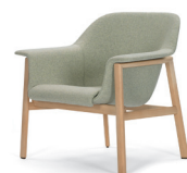
SEDAN LOUNGE CHAIR 2013