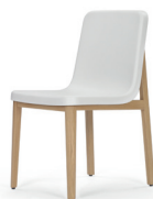
SEDAN CHAIR 2015