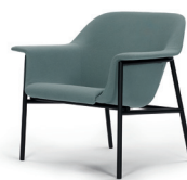
SEDAN LOUNGE CHAIR 2013