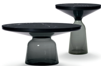
Quarz-grau, Nero Marquina Quartz grey, Nero Marquina