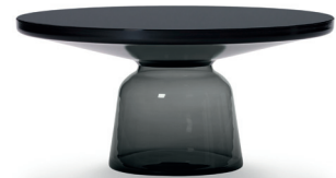
Quarz-grau quartz grey