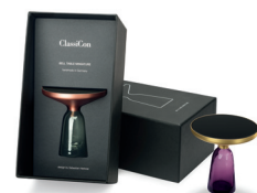
BELL TABLE MINIATURE 2014