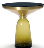
BELL SIDE TABLE 2012