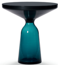
Montana-blau Montana blue

Mesa auxiliar y mesa de centro hechas a mano. Pie de cristal soplado artesanalmente en varios colores. Pieza adicional metálica de acero macizo con pavonado negro, lacado transparente. Tablero redondo de cristal, lacado en negro, o tablero de mármol Nero Marquina o Bianco Carrara, pulido e impregnado.