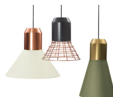
BELL LIGHT 2013