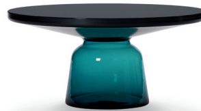
Montana-blau Montana blue