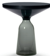
Quarz-grau quartz grey